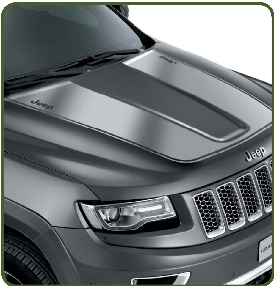
NAKLEJKA NA POKRYWĘ KOMORY SILNIKA W KOLORZE SREBRNYM MATOWYM HOOD DECAL IN MATT SILVER