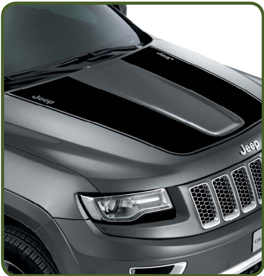
NAKLEJKA NA POKRYWĘ KOMORY SILNIKA W KOLORZE CZARNYM MATOWYM HOOD DECAL IN MATT BLACK